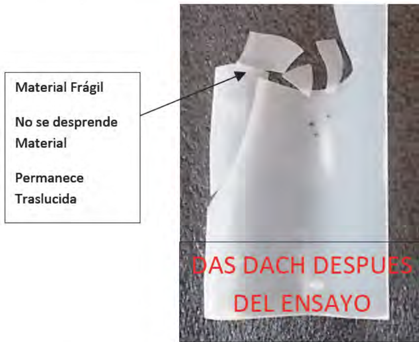
Foto luego de exposición

Este resultado nos asegura que la chapa Das Dach va a sufrir con el paso del tiempo pérdida en su flexibilidad, pero su principal característica que es la translucidez la va a seguir manteniendo por aproximadamente 10 años.